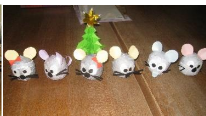
来年の干支 ネズミ